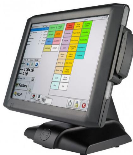
FEC Gladus Smart