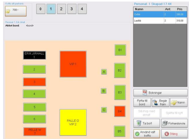
Exempel på bordskarta

ÅTERFÖRSÄLJARE: GRB Gamlestadsvägen 2, B27, 415 02 Göteborg Tel. 031 – 49 70 00 - order@grb.se